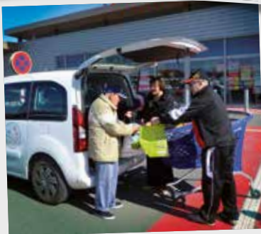
RENCONTRES ET ENTRAIDE ENTRE USAGERS